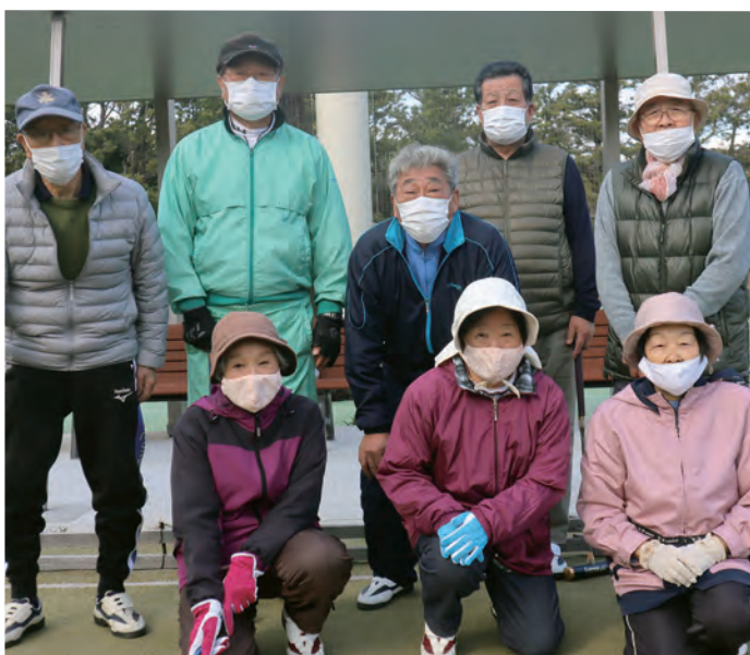
▲コロナに負けるな!! ますます元気、式根島ゲートボールクラブの皆さん

は、職員確保できたことから、4月1日に職員態勢を整え、研修等行った後、直ちに通所介護も開始する。また3月より、社会福祉協議会が施設の一部を事務所として利用開始する。残りのスペースについては村職員が管理し、4月から村事業を行いながら、地域団体や住民にも貸し出しする。