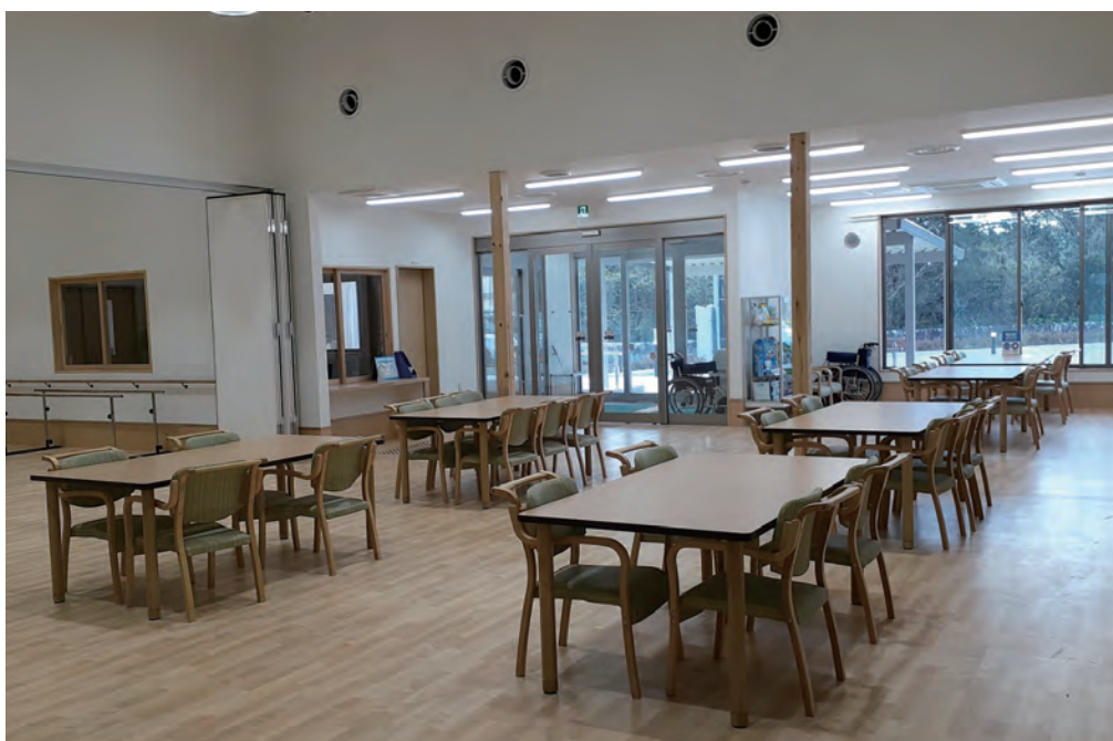
▲式根島福祉健康センター内の交流スペース。 左側に見えるリハビリルームとは仕切れることもでき、柔軟な活用が期待できる。

いて、週2回の実施を予定している。事業ははまゆう会が行い、職員確保は出来ていると聞いている。 は4月からの運営では予定していない。今後どのような形でできるか地域関係機関やサービス事業者と早期実施に向け検討していく。