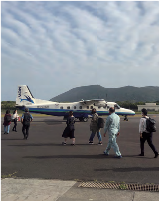
▲島外への医療機関受診は、交通費や滞在費の負担がかさむ。

「空き家の発生抑制・利活用・適正管理」を3本柱として行っている。個人の建物等は個人の財産であ