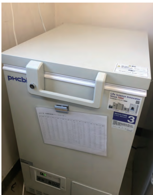
▲本村診療所に設置されたコロナワクチン用のディープフリーザー

26日の週、接種はゴールデンウィーク明けを想定している。配布が確定後、診療所と接種日の決定、村民への周知、接種券配布、予約受付などで約2週間の準備期間を予定している。1回目の配布は500人が2回分、接種は診療所で週1回、3週間を予定している。3月中に関係者による接種シミュレーションを行う。村民には、安全であること、副反応にも対応できることなどを伝えていく。