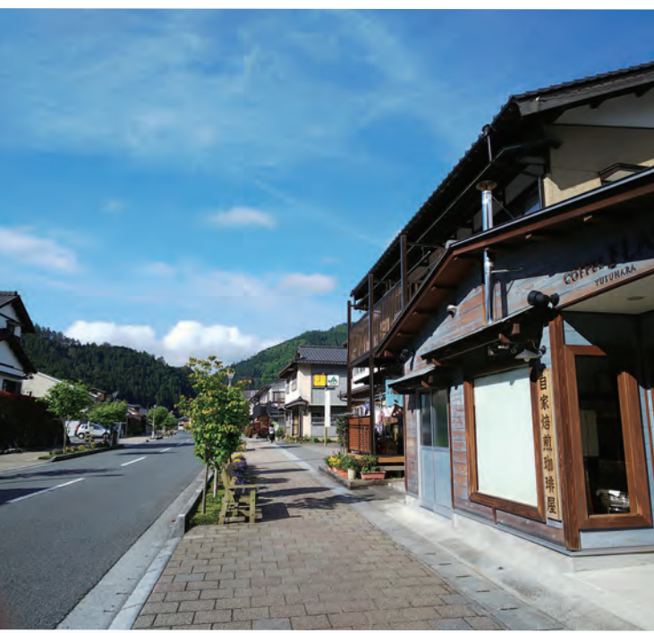
▲高知県梼原(ゆすはら)町の無電柱化例。2019年の議員視察時に撮影

東京都にあつては、令和3年2月に「無電柱化加速化戦略」を策定している。この中で都道や港・空