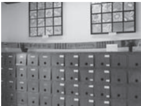
▶ 玄関への展示の様子

式根島中学校は、本年度で66年目を迎える伝統ある学校です。毎年、5月の開校記念日(5月7日)には、卒業生の方をお招きし、全校生徒でその当時の中学校のお話をうかがう会を行っています。今年、さらにこの会にあわせ、正面玄関の下駄箱上に旧木造校舎建設時に使用した柱(幣束)を展示いたしました。