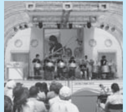
▲ Nijima Steel Band