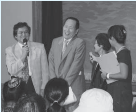
▶ 結婚50周年のインタビュー（新島会場）