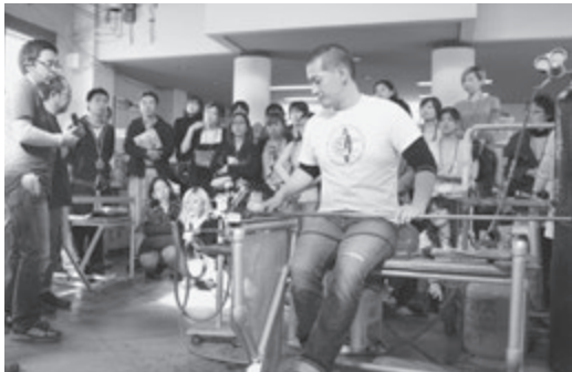
▶ガラス制作の様子

11月6日(水)～16日(土)まで、毎年恒例となった新島国際ガラスアートフェスティバルが開催されました。期間中はアーティストによるデモンストラーションやガラス制作体験、オークションなどが行われ、新島ガラスの魅力が改めて実感できる11日間となりました。