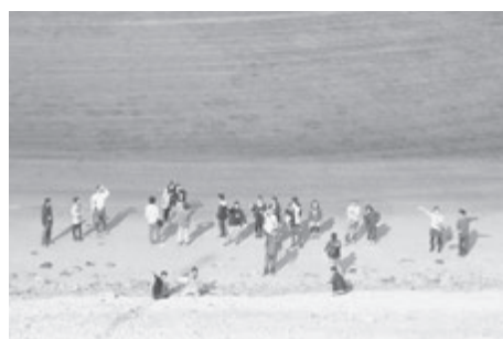
▲ 2日目に訪れた式根島泊海岸

11月16日・17日に開催された、新島村商工会主催の島婚。女性7名、男性21名が参加し、終始和やか雰囲気の中、交流を深めました。島内外からのご参加ありがとうございました。