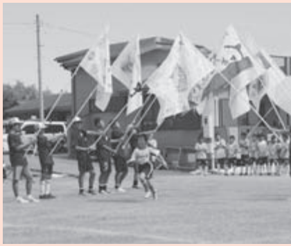
▲決勝戦式根島 SC の入場