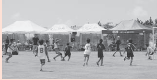
▲新島 FC 対式根島 SC

8月4日〜7日、神津島にて「愛らんどリーグ2015」が開催されました。今年も全11島12チームが参加しました。神津島に到着した4日には、各島からの島じまんを披露する「島じまん発表会」が行われ各島ごとに特色ある発表が行われました。翌5日には、予選リーグが開始され新島FC、式根島SCともに予選を勝ち抜き見事決勝リーグ進出を決めました。