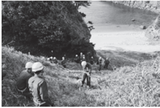
式根島消防団の降下訓練ようす

午前中は、村内で火災想定訓練が実施され、午後からはヘリポートにてポンプ操法訓練、泊海岸駐車場にて降下訓練が行われ、団員らは真剣な表情で海岸を背