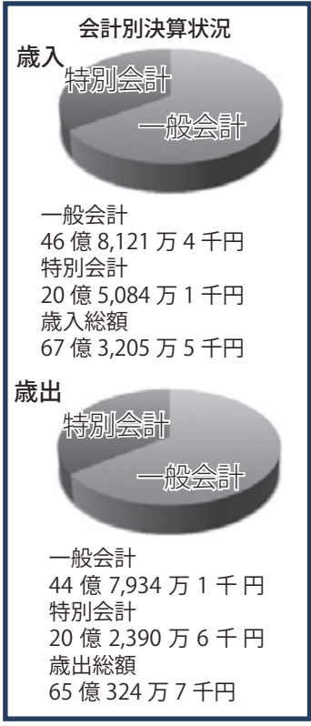
表3：特別会計の種類と平成27年度 特別会計の歳出・歳入