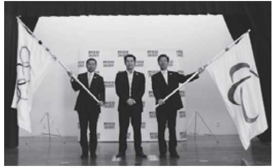
▼フラッグの受け渡しのようす

11月5日（土）、住民センターにて東京2020オリンピック・パラリンピックフラッグツアーのセレモニーが開催されました。 先日、リオデジャネイロオリンピック・パラリンピック競技大会の閉会式にて、東京にオリンピックフラッグが引き継がれました。東京2020オリンピック・パラリンピックフラッグツアーは都内全62区市町村及び被災地を巡回し、2020年の東京大会の開催に向け皆様にオリ