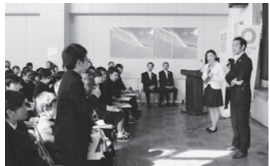
▲トークショーのようす