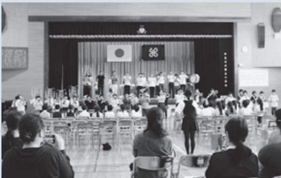
▶鼓隊演奏のようす

11月1日（火）、戦前に民家を借りて始まった新島小学校ですが、今年開校から140年目を迎え、記念式典が開催されました。 来賓の方々からご挨拶を頂いたのち、在校生による校歌斉唱や鼓隊の息のあった演奏が元気いっぱい小学校体育館に響きわたりました。