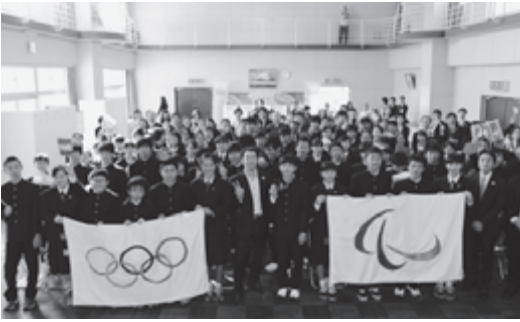
▲参加者全員での記念撮影