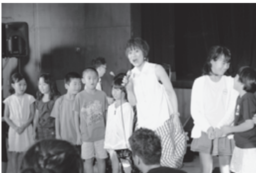
▶式根島講演のようす

従姉弟同士のポップデュオ、「カズン」のお二人をお招きし、世代を超えて楽しめる曲の数々を披露していただきました。また、新島講演ではアンコールに答えて「冬のファンタジー」などが最後に会場を盛り上げました。