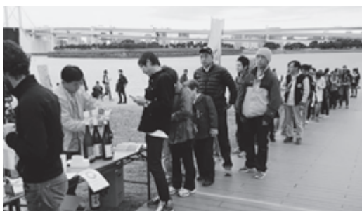
▼試食ブースに長蛇の列

新島の特産品「くさや」を多くの人に知っていただく事を目的として実施した当イベント。昨年以上の来場者数に2,000枚用意した試食用のくさやは全てなくなり、多くの方々にくさやをご堪能いただきました。来場者は2日間で3,000人をこえました。