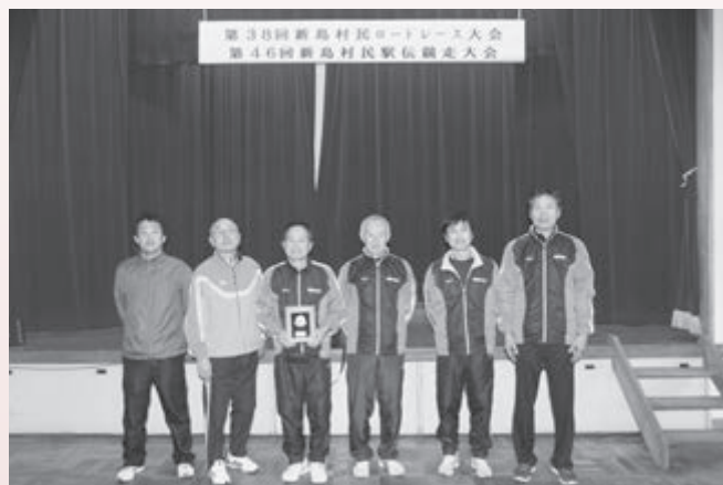
▲羽黒町のみなさん