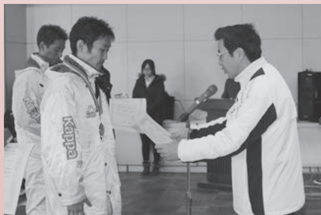
▲消防団分団対抗の部優勝『3分団』チーム