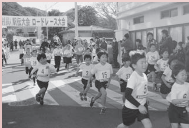
▲ロードレースのスタート