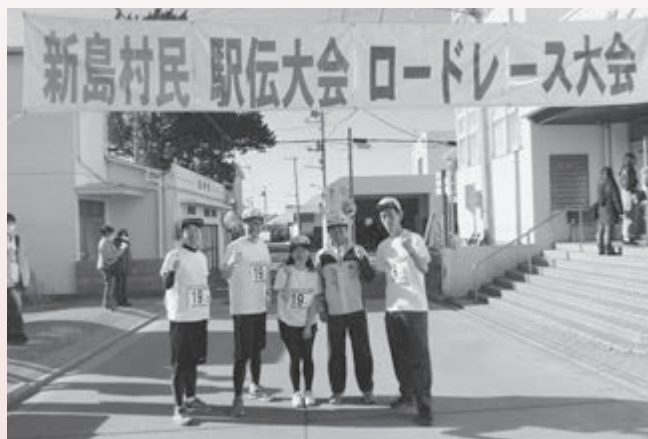
▲株式会社東光高岳のみなさん