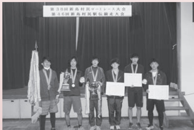
▲優勝した『ポテトサラダ』チーム