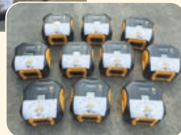
▲大容量バッテリー