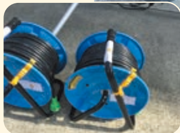
▲防雨型電工ドラム