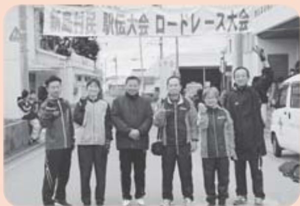
▲羽黒チームの皆さんと青沼村長