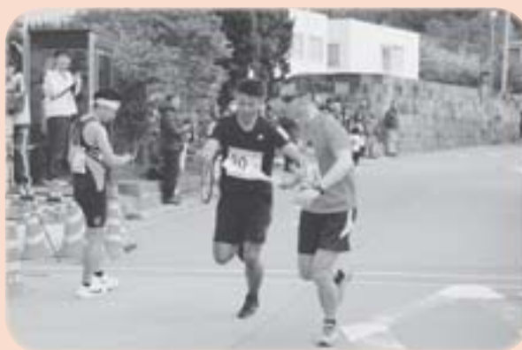
▲襷を渡す選手たち