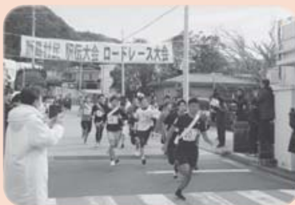
▲駅伝スタートの瞬間