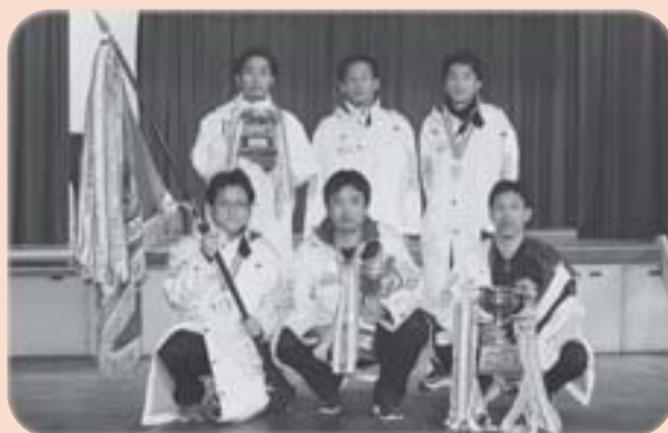
▲総合優勝『3分団』チーム