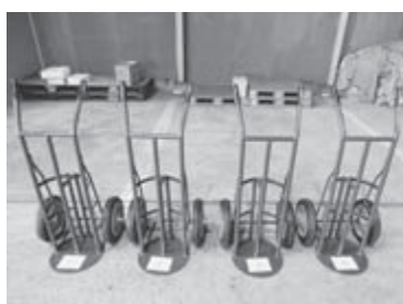
▶テントウエイト台車