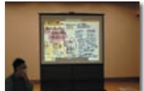
▲発表内容はコーガ石やモヤイ像の活用に関するものが2件、電動スクーターなどの新しい2次交通手段に関するものが2件、水産養殖関連が1件。