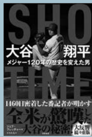
ジェフ・フレッチャー