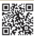
図書室 HP QRコード

■図書室ホームページでは蔵書検索が可能で、新着や貸出ランキングもご覧いただけます。