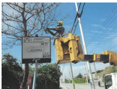
④：松くい虫伐倒駆除