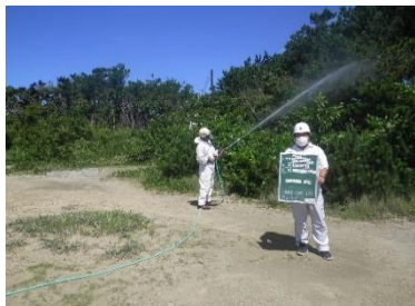
②：松くい虫地上散布