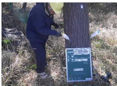
③：松くい虫樹幹注入