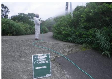
①：トビモンオオエダシヤク地上散布