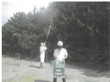
②：松くい虫地上散布