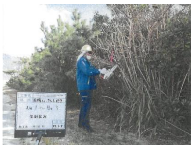
④：松くい虫伐倒駆除