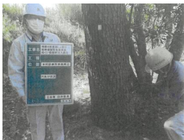
③：松くい虫樹幹注入