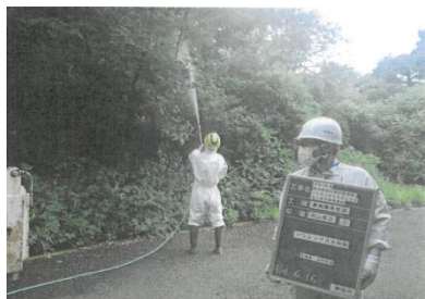
①：トビモンオオエダシヤク地上散布